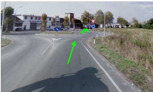
5. Quarta rotonda: svoltare a destra, direzione Pistoia/Via Pistoiese