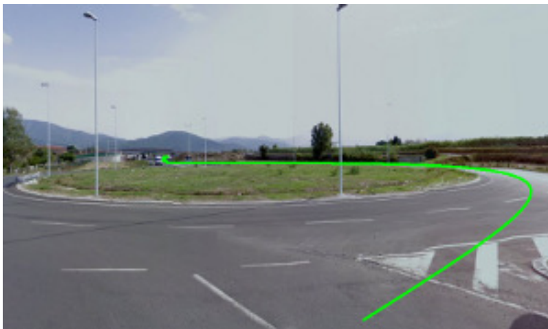
3. Seconda rotonda: ancora direzione Oste/Montemurlo