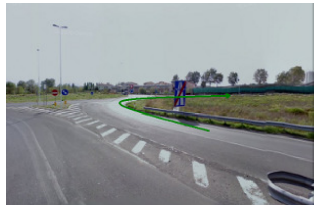
4. Terza rotonda, verso Via Pistoiese, direzione Oste