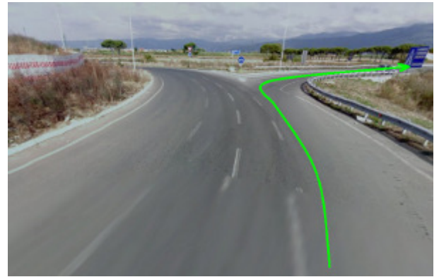
2a. Particolare: direzione Oste/Montemurlo